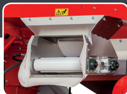
Convoyeur latéral à vitesse réglable

Equipée de ventilateur sur chacun des 2 bacs et de 2 convoyeurs à tapis latéral, cet équipement simple permet de traiter le nettoyage de la vendange volumineuse avec une vitesse d'avancement élevée.