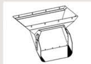
Sélecta 3.1 : Déversoir